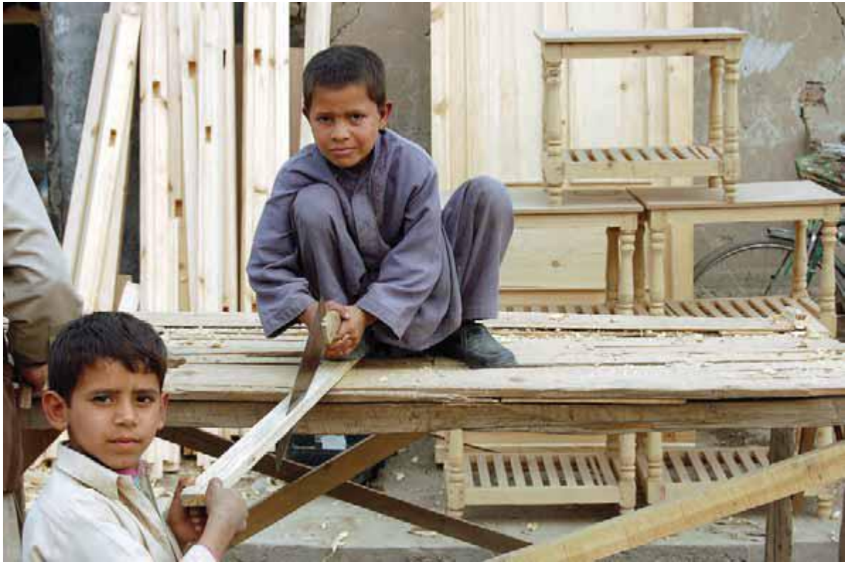
پسران جوان مهارت های نجاری را می آموزند تا به شش درصد کودکان ۵ تا ۱۴ ساله ای ملحق شوند که، طبق ارزیابی یونیسف، همین اکنون کار می کنند.