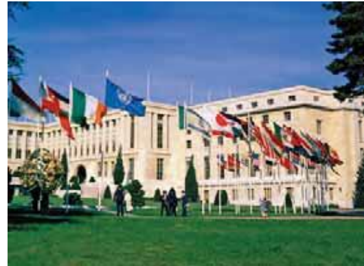
دفتر ملل متحد در ژنو