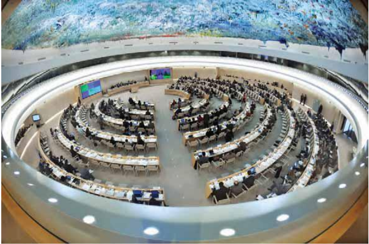
تالار شورای حقوق بشر در ژنو