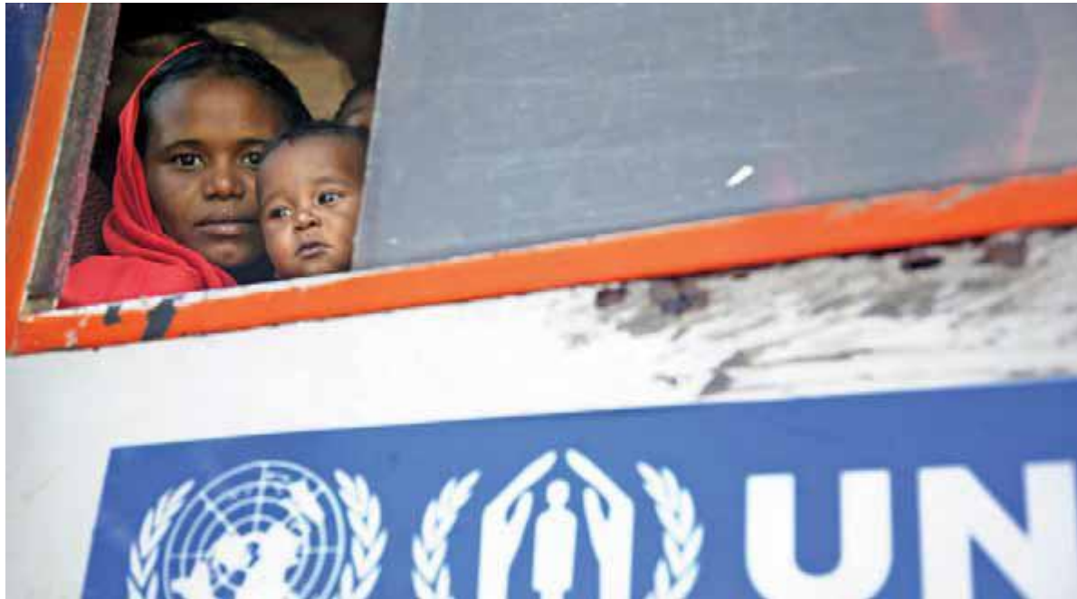
مادر و دخترش از کمپ آرامبا به دهکده محل سکونتشان در سه جانا شمال دارفور باز می گردند.