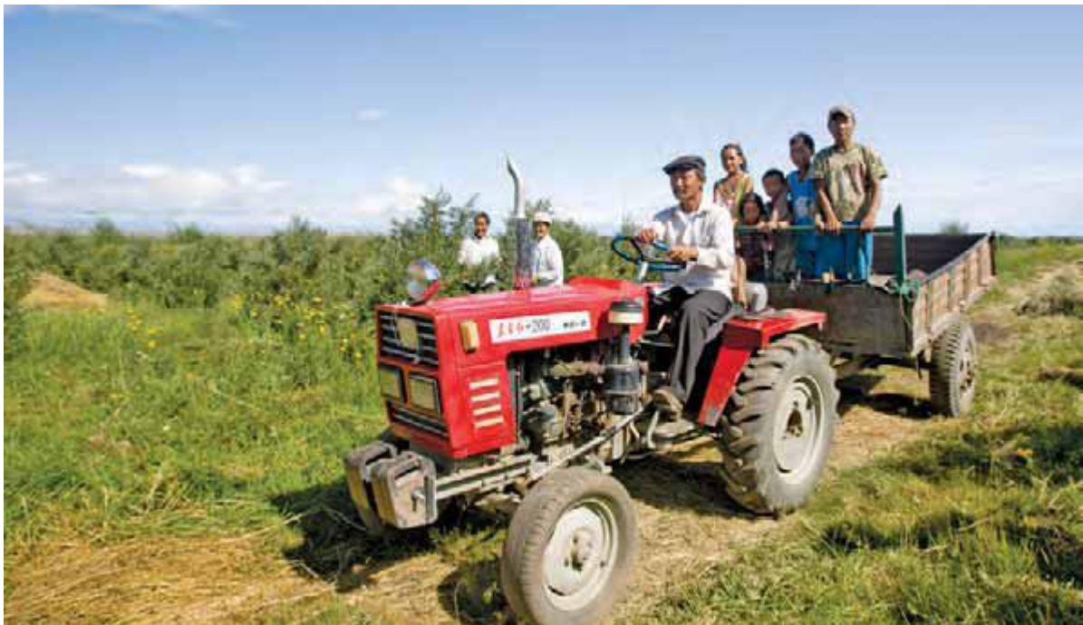
کشاورزان مغول از طرحی بهره مند می شوند که توسط برنامه توسعه ملل متحد اداره شده و به آنان امکان می دهد زمین های بلا استفاده را به پارک های کشاورزی مبدل سازند.