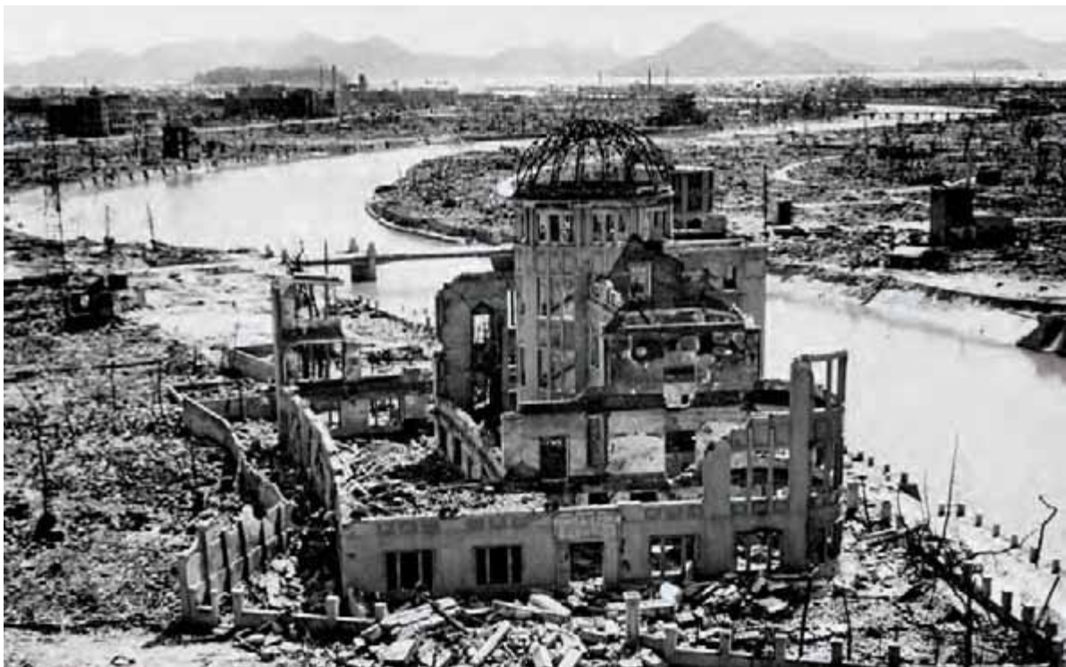
در سال ۱۹۴۵، بیش از ۱۲۰۰۰۰ تن در هیروشیما و ناگازاکی (ژاپن) زیر بمباران اتمی جان خود را از دست دادند. بنای یادمان صلح هیروشیما، تنها سازه برجای مانده در محل انفجار نخستین بمب، در سال ۱۹۹۶ در زمره میراث جهانی یونسکو قرار گرفت.

در نظر داشته باشید: در سال ۱۹۴۵، پس از پرتاب دو بمب اتمی بر هیروشیما و ناگازاکی در ژاپن، جنگ جهانی دوم (۱۹۳۹-۱۹۴۵) به پایان رسید. از آن زمان، جهان شاهد جنگ های بیشتری بوده است. این درگیری ها حدود ۲۰ میلیون کشته، با بیش از ۸۰ درصد غیرنظامی، بر جای نهاده است. اگر چه هیچ کس تا به امروز دیگر از سلاح هسته ای استفاده نکرده است، حداقل هشت کشور در حال حاضر وجود دارد که از سلاح های هسته ای برخوردارند (قدرت های هسته ای). با وجود کاهش چشمگیر، که بلافاصله پس از پایان جنگ سرد و فروپاشی اتحاد جماهیر شوروی به وقوع پیوست، ذخیره کل سلاح های هسته ای در جهان در حال حاضر بالغ بر ۲۳۰۰۰ کلاهک هسته ای است، باقابلیت تخریب جمعی ۱۵۰،۰۰۰ بمب در اندازه هیروشیما.