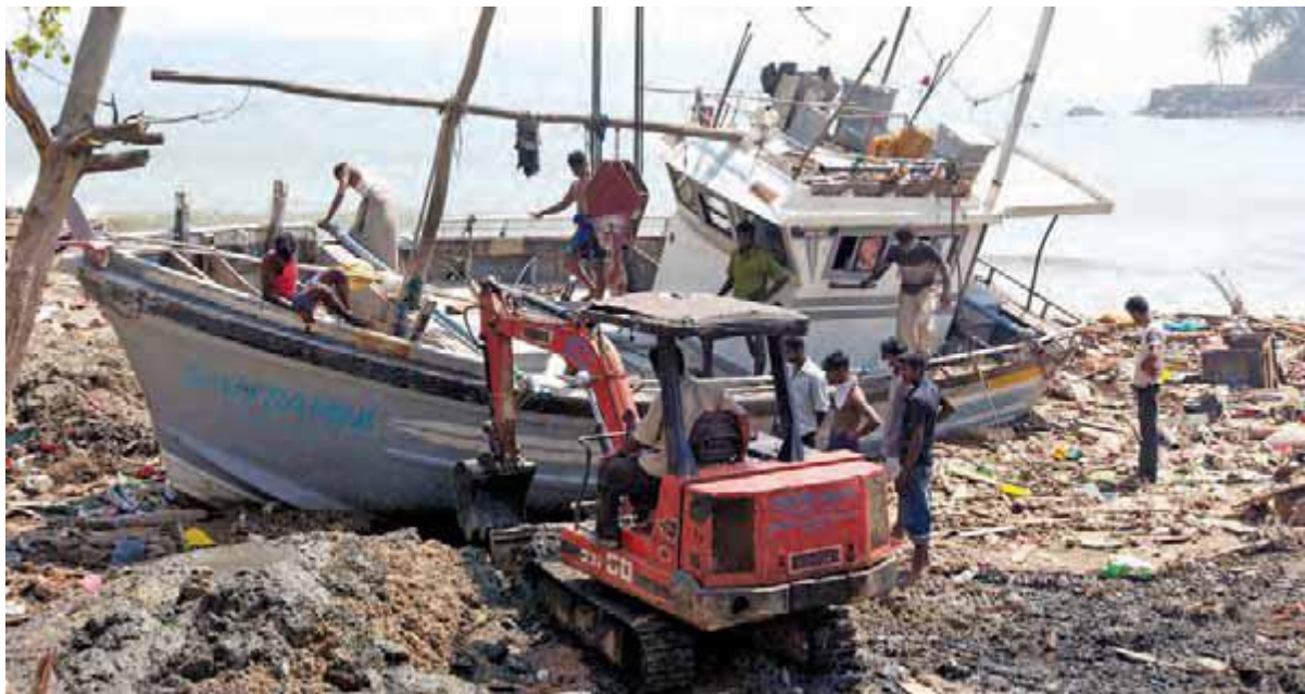
سريلانكا بعد از سونامی ۲۶ دسامبر ۲۰۰۴

نوع دیگری از فجایع، زاده دست انسان است که با درگیری یا جنگ های داخلی ایجاد می شود. بلاایای ساخته دست بشر میلیون ها نفر را در سراسر جهان بی خانمان کرده منجر به حدوث طیف گسترده ای از شرایط اضطراری، از جمله بحران های غذایی و جابه جایی های عظیم جمعیت می شود. قربانیان فجایع انسانی معمولاً مجبور به ترک خانه و زندگی خود شده در لبه پرتگاه وجود بی حمایت از حقوق اولیه شان به سر می برند. در زمان تبعید، بسیاری در معرض خشونت، سوء استفاده یا بهره کشی قرار می گیرند. آنان ممکن است در به دست آوردن امکانات تامین آب سالم به مشکل برخوردند چرا که چاه ها اغلب آلوده یا توسط رزمندگان درجنگ مین گذاری شده است. گرسنگی و سوء تغذیه، از دست دادن ایمنی و امنیت و دسترسی اندک به خدمات اساسی، به ویژه مراقبت های بهداشتی، نمونه هایی است از دشواری های ایجاد شده با بلاایای ساخته دست بشر.