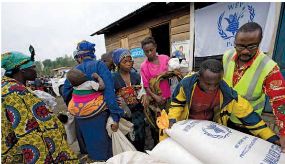
امداد اضطراری مواد غذایی در کیوو شمالی، جمهوری دموکراتیک کنگو.

با وجود چنین تفاوت های بسیاری، اشتراکی زیاد میان آنان برقرار است. امدادورزان بشردوست خود را وقف کمک به کسانی می کنند که به یاری شان نیازمندند، فارغ از نژاد، مذهب و موقعیت اجتماعی دریافت کننده کمک. آنان در مکان هایی فعالند که اغلب دور، دشوار و نامساعدند. آنان زندگی خودشان را برای کمک به دیگران به خطر می اندازند. بسیاری همکاران یا عزیزان شان را در طول سال ها از دست داده اند. کار انسان دوستانه خطرناک تر شده است. سطح تهدیدات و تعداد حملات عمدی به سازمان های کمک رسانی، و کارکنان، تجهیزات و امکانات شان به نحوی چشمگیر بالاتر رفته است. در سال ۲۰۱۰، ۲۴۲ امدادگر، کشته، مجروح یا ربوده شدند.