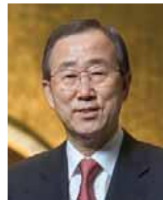
بان کی مون ( کره جنوبی ): ۲۰۰۷ تا کنون