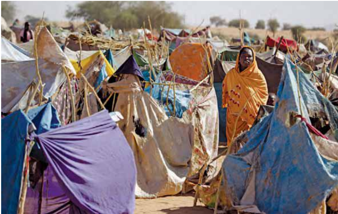
زنی در اردوگاه آوارگان زمزم در الفاشر شمال دارفور که بعد از درگیری های سیاسی میان دولت سودان و نیروهای شورشی برپا گردید.

« بازگشت کنندگان پناهندگان سابقند که به کشورها یا مناطق مبدأ پناه خود پس از مضي زمان در تبعید باز می گردند. مراجعت کنندگان به پشتیبانی مداوم و کمک برای ادغام مجدد نیاز دارند تا اطمینان حاصل شود می توانند زندگی شان را در خانه بازسازی کنند. در سال ۲۰۰۹، گزارش شد بیش از پنج میلیون آواره داخلی و ۲۵۱,۰۰۰ پناهنده به خانه بازگشته اند.