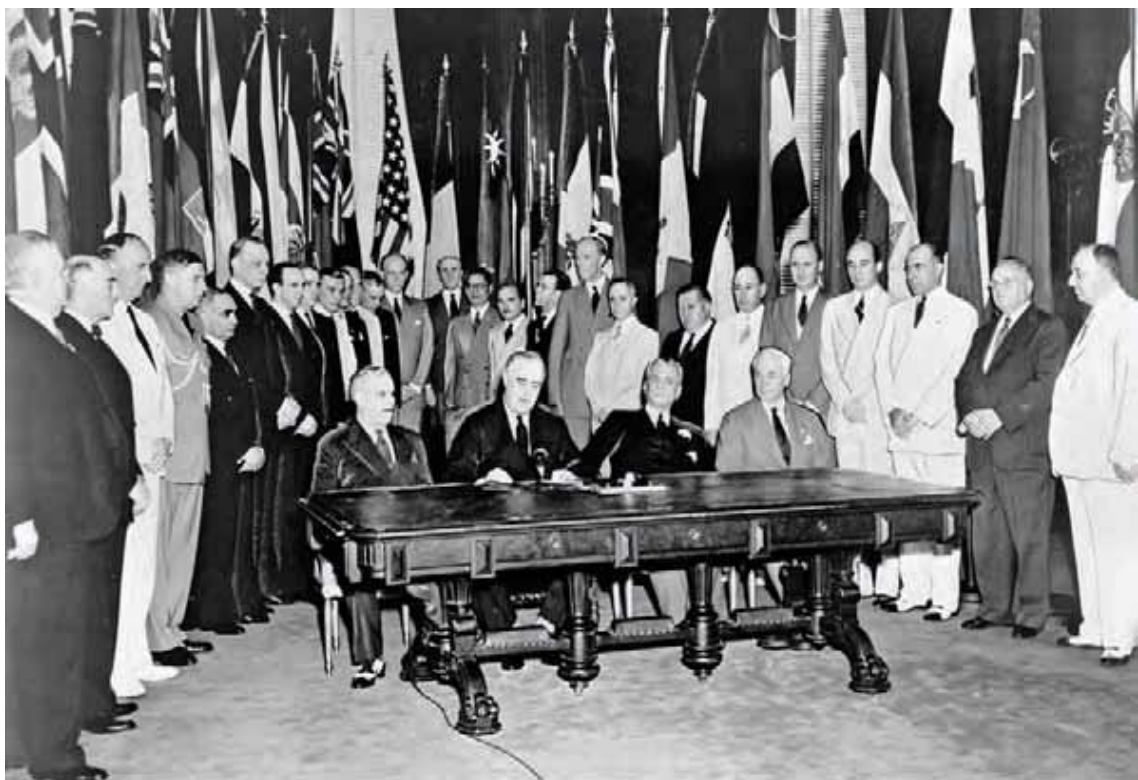
امضا اعلامیه ملل متحد (۱ ژانویه ۱۹۴۲)

سه سال بعد، هنگام تدارک کنفرانس سان فرانسیسکو، تنها آن دسته از کشورهایایی که به متحدین اعلام جنگ داده و عضو بیانیه ماه مارس ۱۹۴۵ سازمان ملل متحد بودند به شرکت در آن کنفرانس دعوت شدند.