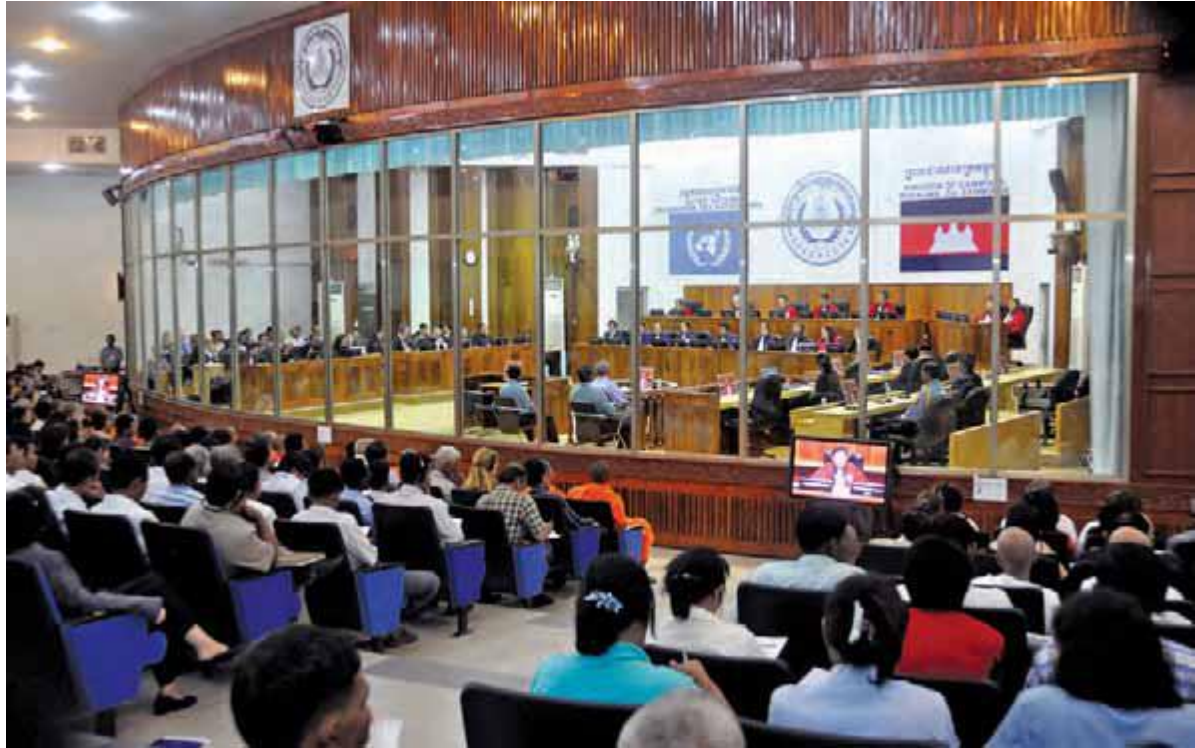
شعب فوق العاده دادگاه های کامبوج در زمان جلسه

« دادگاه ویژه برای لبنان کسانی را تحت پیگرد قانونی قرار می دهد که مسئولیت حمله تروریستی ۱۴ فوریه ۲۰۰۵ در بیروت را دارند، که منجر به مرگ نخست وزیر لبنان، رفیق حریری، و مرگ یا آسیب دیدگی بسیاری دیگر شد.