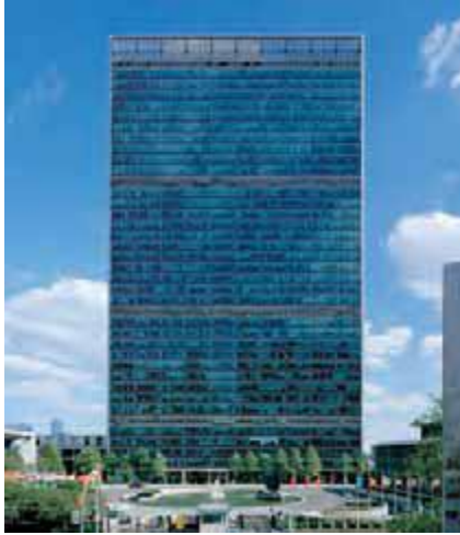
مقر سازمان ملل در نیویورک