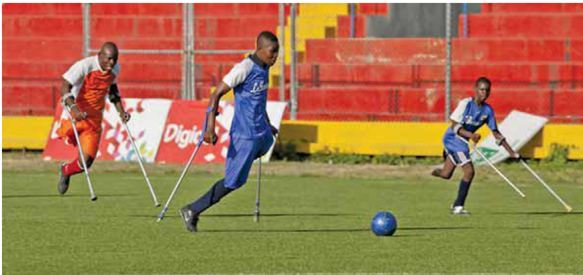
بازیکنان در مسابقه ای برای مردان معلول در ورزشگاه ملی پورتو پرنس هائیتی رقابت می کنند

کنوانسیون حقوق افراد دارای معلولیت پاسخ جامعه بین المللی است به تاریخ طولانی تبعیض، محرومیت و انسانیت زدایی از این گروه به حاشیه رانده شده. تعداد چشمگیری از کشورها کنوانسیون و پروتکل آن را امضا کرده اند.