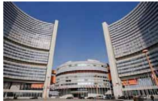
دفتر ملل متحد در وین