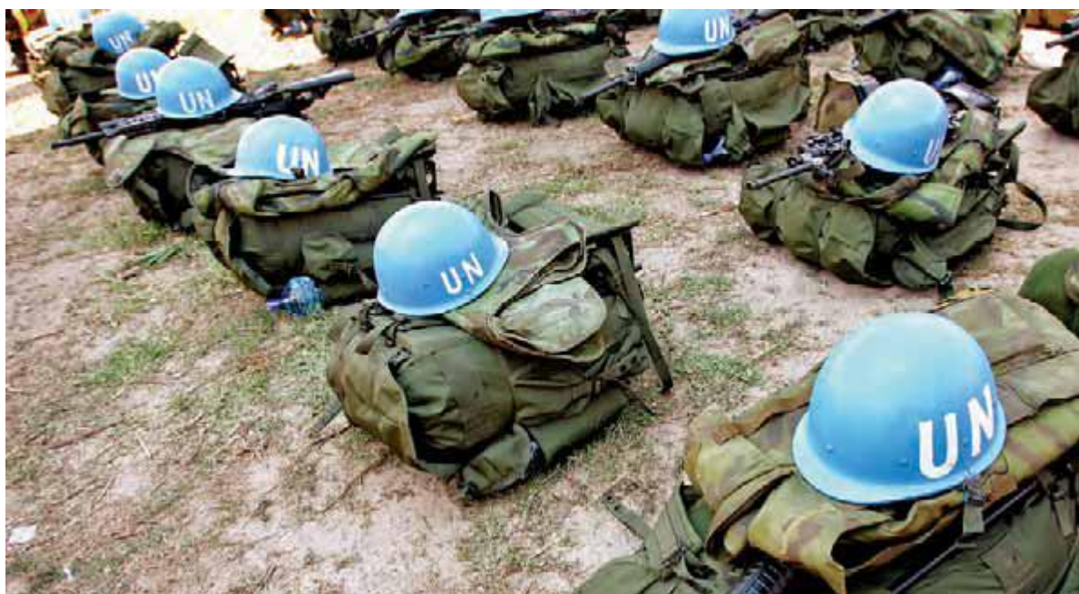
کلاه خود آبی بخشی از تجهیزات صلح بانان به شمار می آید و همچنین لقبیست برای اشخاص حافظ صلح.

در گذشته، نیروهای حافظ صلح به طور عمده در حفظ صلح میان ملل متخاصم درگیر بودند. امروزه، مخاصمه به گونه روبه افزایشی در حال تبدیل به مسئله ای داخلی است که بسیاری کشورها درون مرزهای خودشان درگیر آنند. به علت ناآرامی های داخلی و درگیری های قومی، برخی دولت ها از اعمال قدرت بر بخش های بزرگی از قلمرو شان عاجزند و این سبب درد و رنج گروهی بزرگ از انسان ها می شود. در چنین وضعیت هایی، اغلب از سازمان ملل خواسته می شود به دو امر بپردازد: از یک طرف، مذاکره برای حصول سازش و از طرف دیگر، ارائه کمک های اضطراری به مردم آسیب دیده از جنگ. با کار در شرایط سخت، سازمان ملل متحد کمک های بشر دوستانه را با تلاش برای حل و فصل بحران به طوری که مردم بتوانند زندگی شان را باری دیگر به دور از ترس ادامه دهند ادغام می کند.