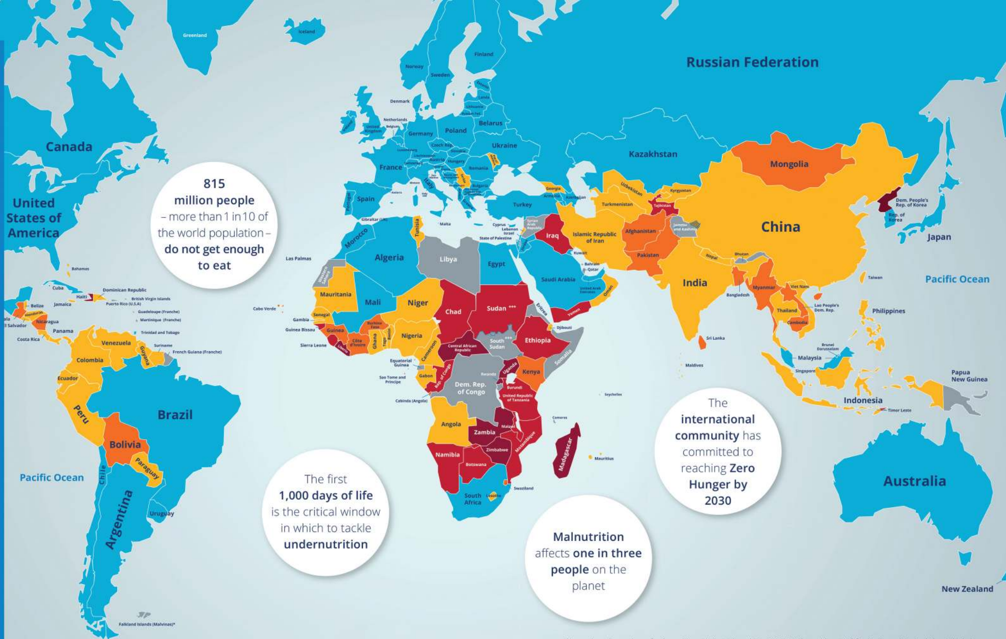
PREVALENCE OF UNDERNOURISHMENT IN THE POPULATION (PERCENT) IN 2014-16